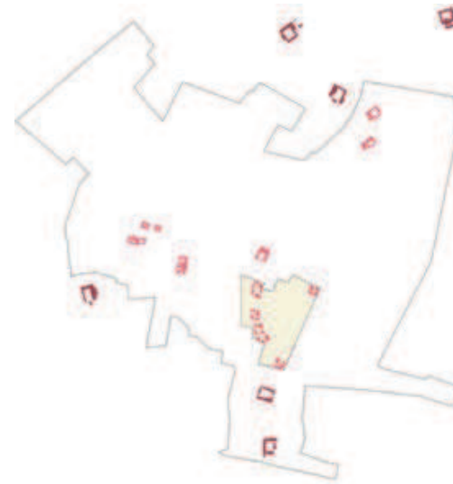
Höfe in der Umgebung