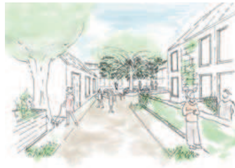
Perspektive Hof Atmosphäre